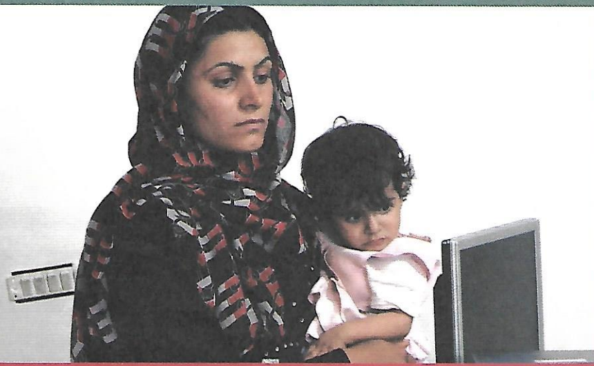
W ośrodku zdrowia w Kaa.